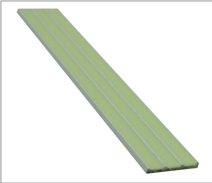
G3-001 Направляющая полоса 16мм